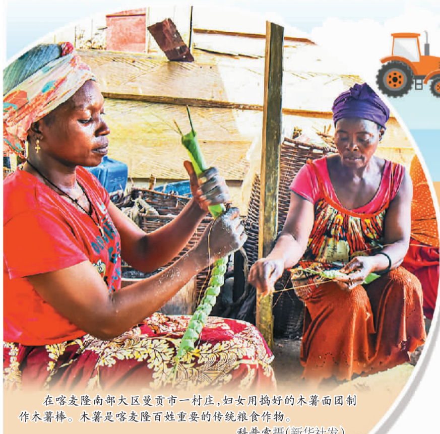
在喀麦隆南部大区曼贡市一村庄，妇女用捣好的木薯面团制作木薯棒。木薯是喀麦隆百姓重要的传统粮食作物。

为了应对粮食、燃料和肥料价格的上涨，各国已投入超过7100亿美元用于为10亿人提供社会保障，其中约3800亿美元用于发放补贴。然而，高收入国家用于