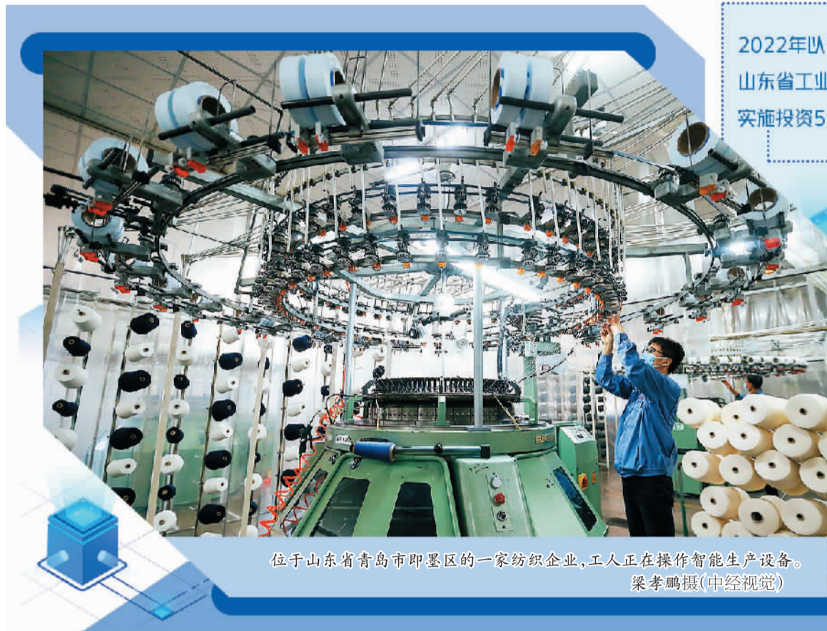
位于山东省青岛市即墨区的一家纺织企业,工人正在操作智能生产设备。

随着白鹤滩水电站及外送直流工程的投运,四川攀西电网将通过8回500千伏线路与四川主网相联、通过4回特高压直流外送华东和华中电网。