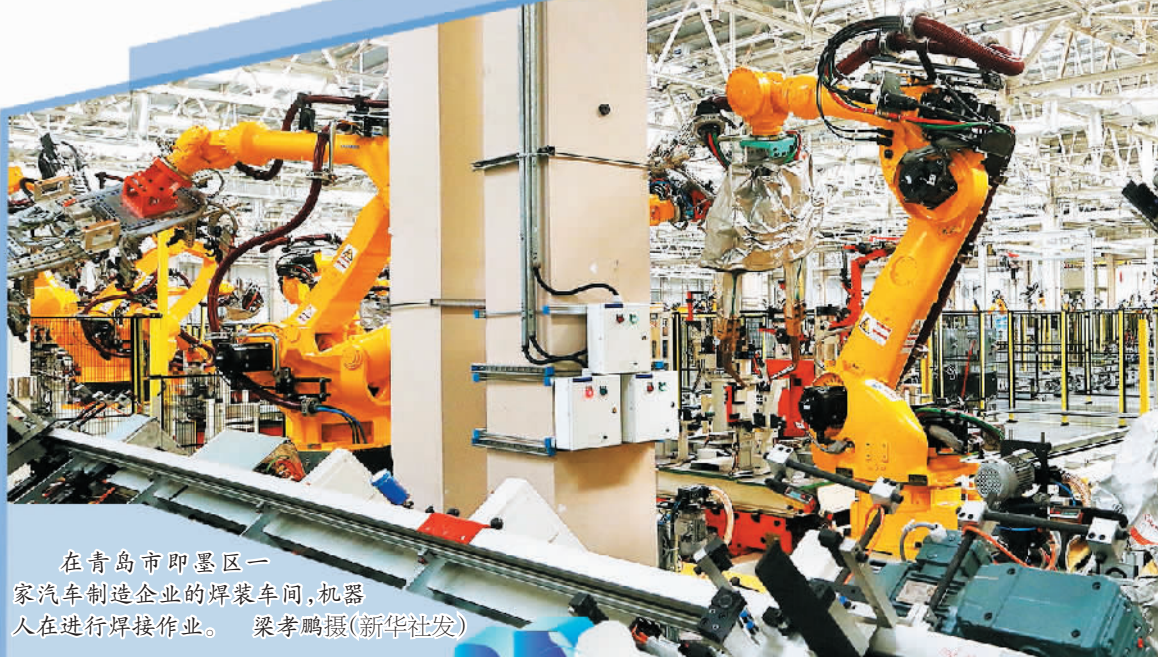
在青岛市即墨区一家汽车制造企业的焊装车间,机器人在进行焊接作业。

今年以来,伴随疫情防控转入新阶段,我国经济回暖势头强劲。相关数据显示,1月制造业生产景气水平明显回暖,服务业恢复迅速,带动非制造业实现触底反弹,市场主体发展信心增强,经济增长的强大动能快速释放。本版从本期开始推出系列报道,聚焦行业企业奋力开创2023年新局面,推动实现质的有效提升和量的合理增长,走好高质量发展之路的新征途。