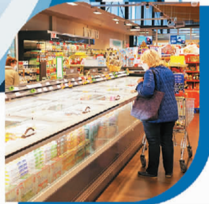
右图 消费者在德国柏林一家超市选购商品。

洲消费者和企业应对居高不下的能源价格。该限价机制将于2023年2月15日启动,该机制的出台同样对德国的能源价格“降温”构成一定影响。