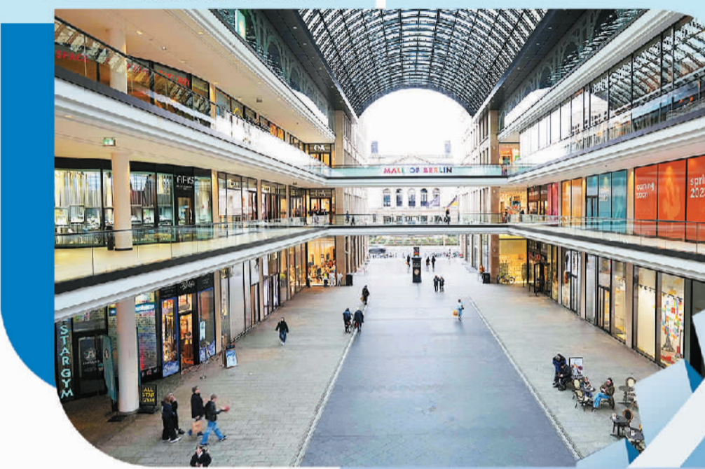
上图 人们从德国柏林的一家商场走过。