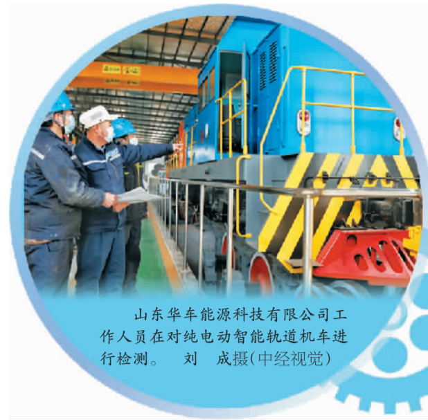
山东华车能源科技有限公司工作人员在对纯电动智能轨道机车进行检测。

做威 莱芜钢铁集团内长长的铁路轨道上，一辆绿色的火车头拉着七八节满载铁水的车厢缓缓驶过。记者在现场闻不到柴油味，也听不到隆隆的机车声。