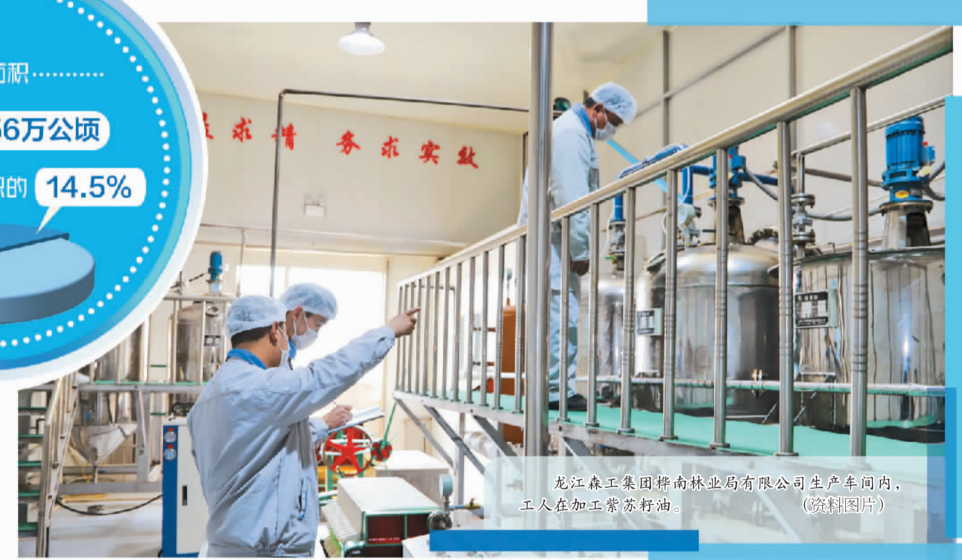
龙江森工集团桦南林业有限公司生产车间内，工人在加工紫苏籽油。(资料图片)

为了开辟新的增收途径，黑龙江省亚布力林业有限公司还建立起集绿化苗木产业前沿信息发布、展示、交易和物流等功能于一体的绿化苗木购销平台，苗木的产