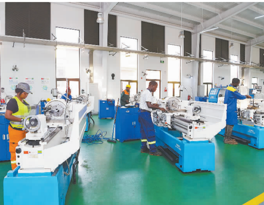
1月10日，在加蓬首都利伯维尔的思考克经济特区，思考克国际职业教育和培训中心的学生进行车削加工操作训练。思考克国际职业教育和培训中心由中国航空技术国际控股有限公司联合成都航空职业技术学院等院校共建。2021年4月，中心揭牌，第一批共160名学生获得加蓬总统奖学金，接受电子电工、机械加工、焊接技术3个专业的培训学习。

人次，其中外国游客661万人次，中国游客达236.2万人次。2019年柬埔寨旅游业创造了49.2亿美元的收入，对柬埔寨国内生产总值的贡献率达12%，解决了60多万人的就业。