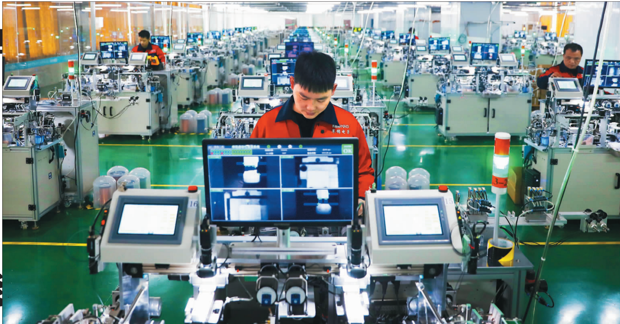
▲位于宜春市上高县的江西雄狮科技有限公司,员工忙着生产。上高县大力发展数字经济,建成48万平方米标准化厂房,吸纳30多家企业“拎包入驻”。

绿色发展体系加快构建。锂电新能源等绿色产业蓬勃发展,集聚了宁德时代、比亚迪、国轩高科、赣锋锂业等头部企业,已形成贯通“锂矿—锂盐—锂材料—锂电池—锂应用—锂回收”全产业链发展模式,2022年主营业务收入突破1000亿元。宜春正着力建设碳酸锂、正极材料、负极材料、锂电池、锂电应用五大基地,打造全国知名的锂产品交易中心,加快构建“全链条、全绿色、全球样板”发展格局。