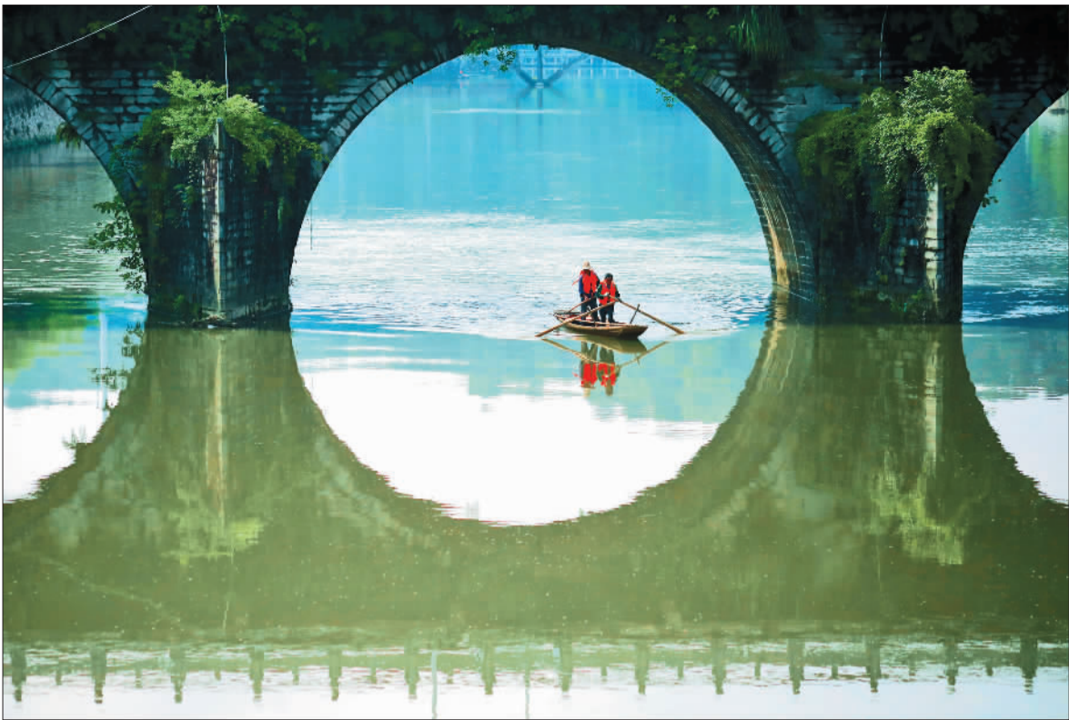
◀宜春市宜丰县桥西乡境内的耶溪河水域保洁员在打捞漂浮物,守护家乡清水。