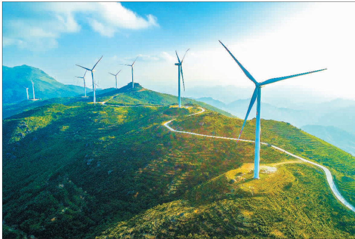
▶丰城市荷湖乡玉华山风电场,风力发电机正在输送清洁能源。近年来,丰城市大力发展风电、光伏发电、水电、生物质发电等清洁能源,助推能源向绿色低碳转变。