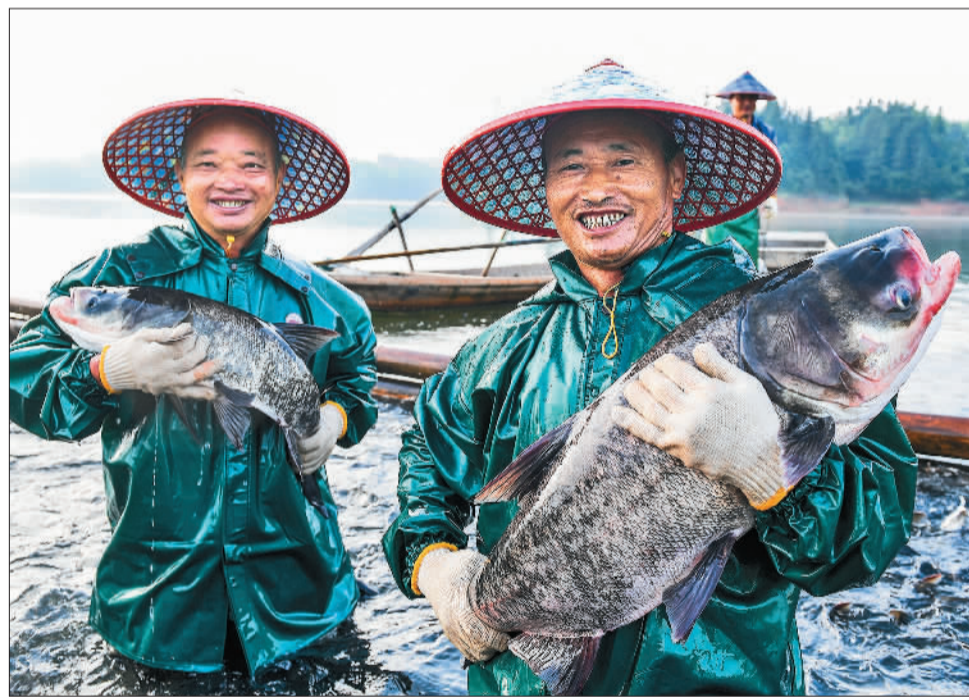
▲宜春市靖安县官庄镇罗湾水库,渔民在展示捕捞到的鳊鱼。生态渔业已成为当地特色优势产业和农民增收的有效途径。