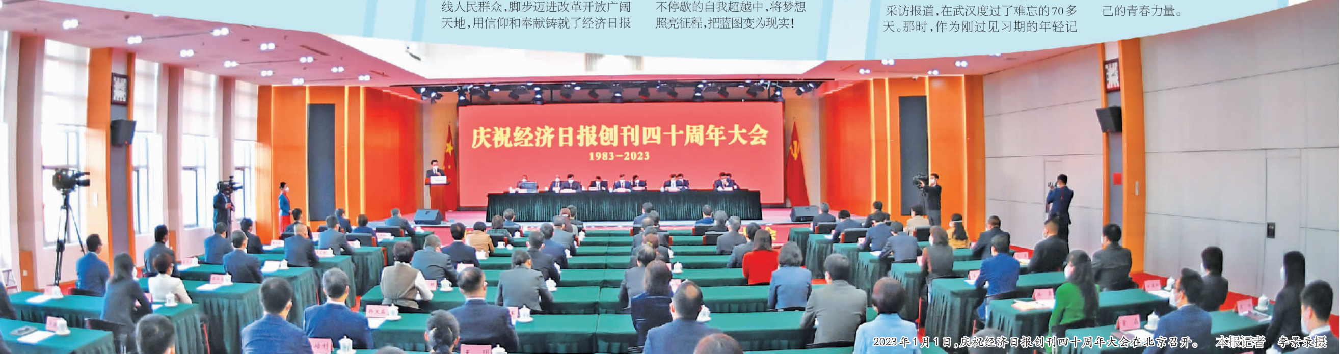
2023年1月1日，庆祝经济日报创刊四十周年大会在北京召开。

四十不惑。经济日报在党中央的关心关爱和编委会的带领下，有了更加明晰的发展路径，有了更可期待的未来。躬逢其盛，幸甚至哉。我代表年轻的经济报人表态，一定牢牢抓住机遇，不负时代，不负韶华，为党的新闻事业、为经济日报的发展，贡献自己的青春力量。