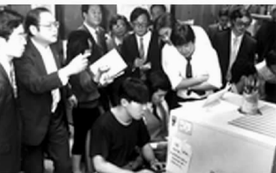
▲经济日报率先采用计算机拼版新技术。(资料图片)