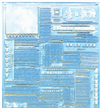
▲经济日报最后一块铅版(3D打印复制品)。(资料图片)

1987年12月2日，相关部委组织通过“华光Ⅲ型”计算机激光报纸排版系统国家级验收。由此，经济日报成为全球首家采用计算机激光屏幕组版、整版输出的中文报纸，奠定了在中国报纸印刷工艺现代化进程中的重要历史地位。