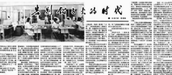
▲经济日报刊报道《告别铅与火的时代》。(资料图片)