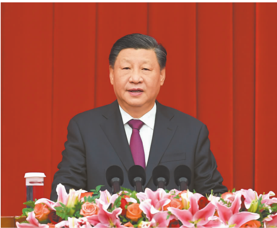
军委主席习近平在十二月三十日