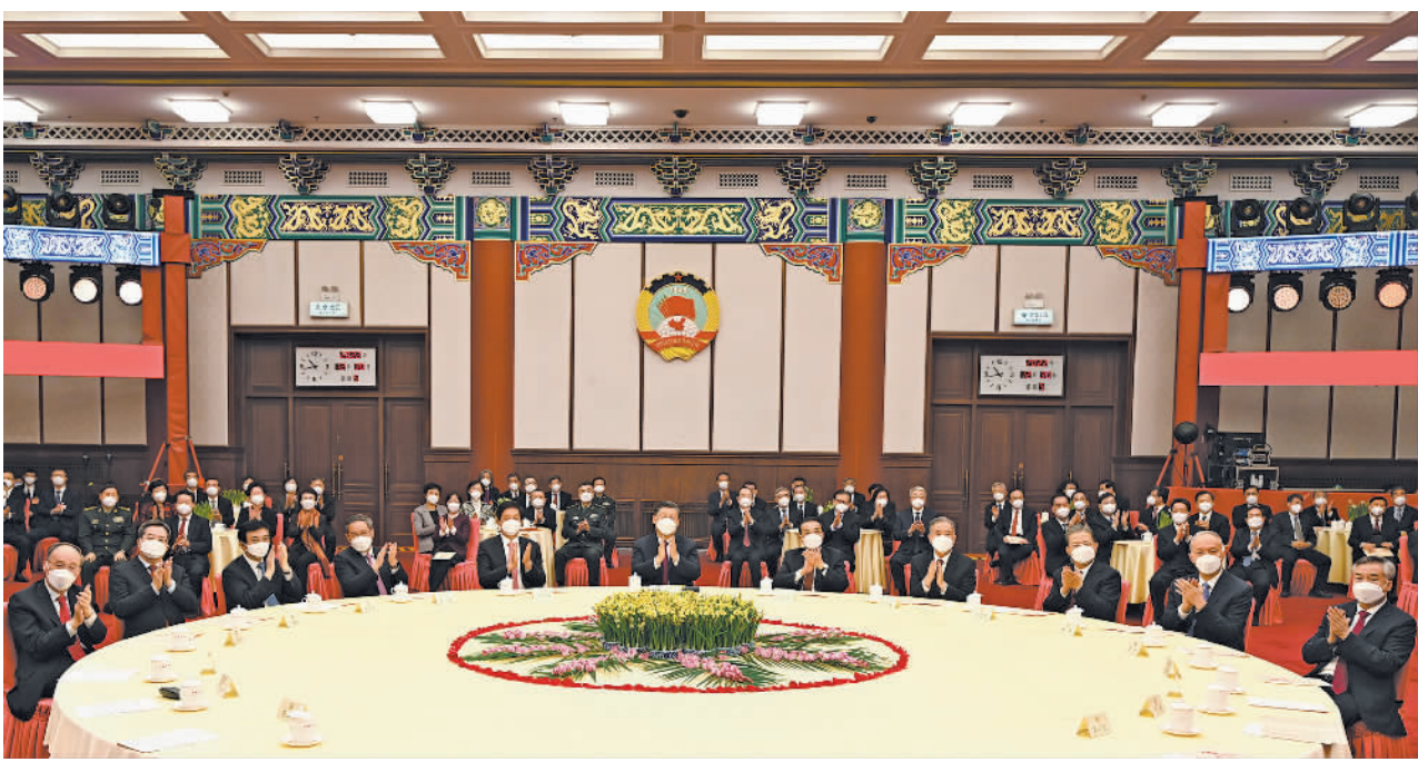
12月30日,全国政协在北京举行新年茶话会。党和国家领导人习近平、李克强、栗战书、汪洋、李强、赵乐际、王沪宁、蔡奇、丁薛祥、李希、王岐山出席茶话会并观看演出。

新华社北京12月30日电 中国人民政治协商会议全国委员会12月30日上午在全国政协礼堂举行新年茶话会。党和国家领导人习近平、李克强、栗战书、汪洋、李强、赵乐际、王沪宁、蔡奇、丁薛祥、李希、王岐山等同各民主党派中央、全国工商联负责人和无党派人士代表、中央和国家机关有关方面负责人以及首都各族各界人士代表欢聚一堂,共迎2023年元旦。