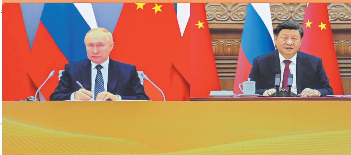
12月30日下午,国家主席习近平在北京同俄罗斯总统普京举行视频会晤。

ВСТРЕЧА ПРЕДСЕДАТЕЛЯ КНР СИ ЦЗИНЬПИНА И ПРЕЗИДЕНТА РФ В. В. ПУТИНА В ФОРМАТЕ ВИДЕОКОНФЕРЕНЦИИ