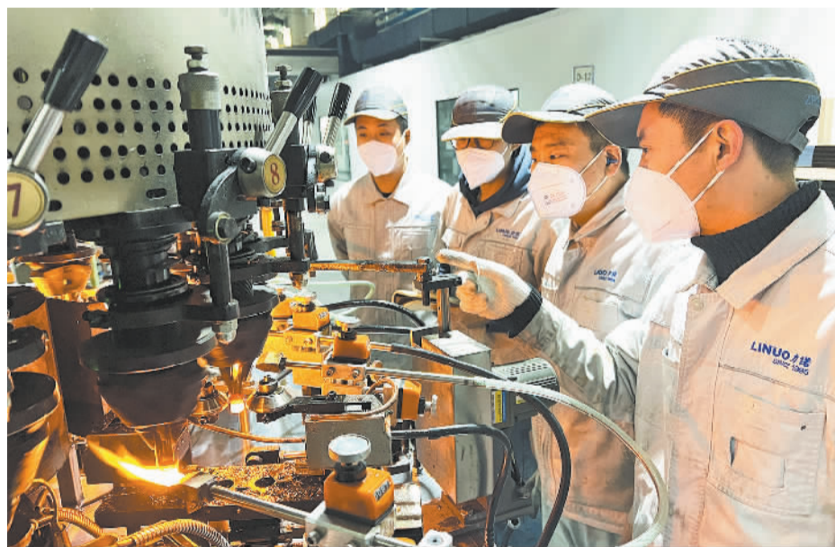
12月23日,山东力诺特种玻璃股份有限公司技术能手正在中硼硅大板生产线进行小瓶生产技术讲解。近年来,山东商河县加大高技能人才培养力度,全面加快技术人才队伍建设,赋能产业转型升级创新发展。