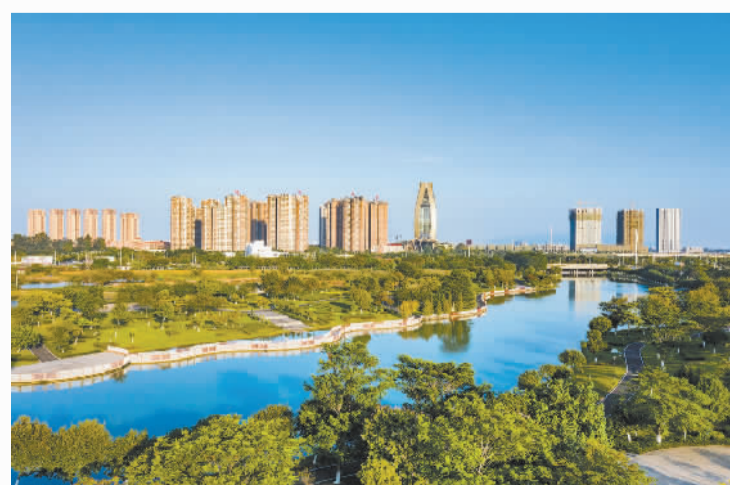
位于佛山高明区的智湖湿地公园,是高明区的城市水名片之一