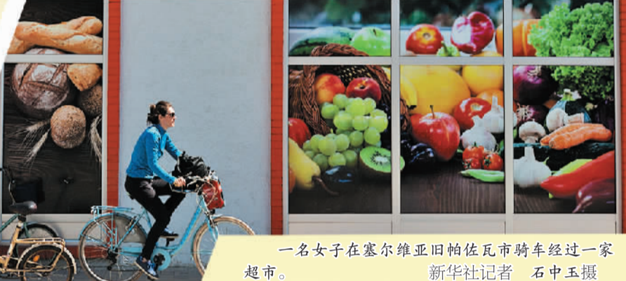
一名女子在塞尔维亚旧帕佐瓦市骑车经过一家超市。

响,全球粮食价格出现了回落。根据联合国粮农组织最新发布的数据,11月份,全球食品价格指数平均为135.7点,国际小麦价格已恢复到年初水平。然而,这并不足以令市场松开紧绷的神经。业内人士表示,推动市场走高的潜在因素如地缘冲突、贸易限制等仍无明显缓解迹象,2023年全球粮食危机恐将进一步加剧。