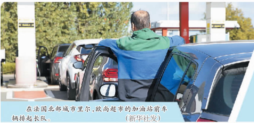
在法国北部城市里尔,欧尚超市的加油站前车辆排起长队。