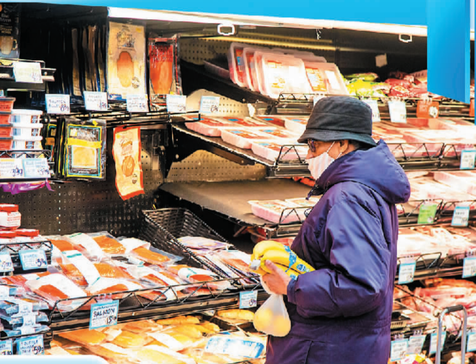
12月13日,顾客在美国纽约一家商店购物。

分析人士认为,未来,许多新兴市场与发展中国家可能面临更加艰难的局面,一方面,美联储的紧缩政策仍会持续,发展中国家仍将受到显著冲击;另一方面,发达经济体出现经济衰退,将直接影响发展中国家的出口,从而导致其经济增长前景进一步恶化。