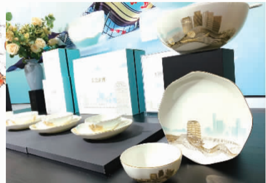
山海相逢,大美淄博。第22届中国(淄博)国际陶瓷博览会上,淄博城市文化礼物、汉青陶瓷出品的“大美淄博”向社会发布