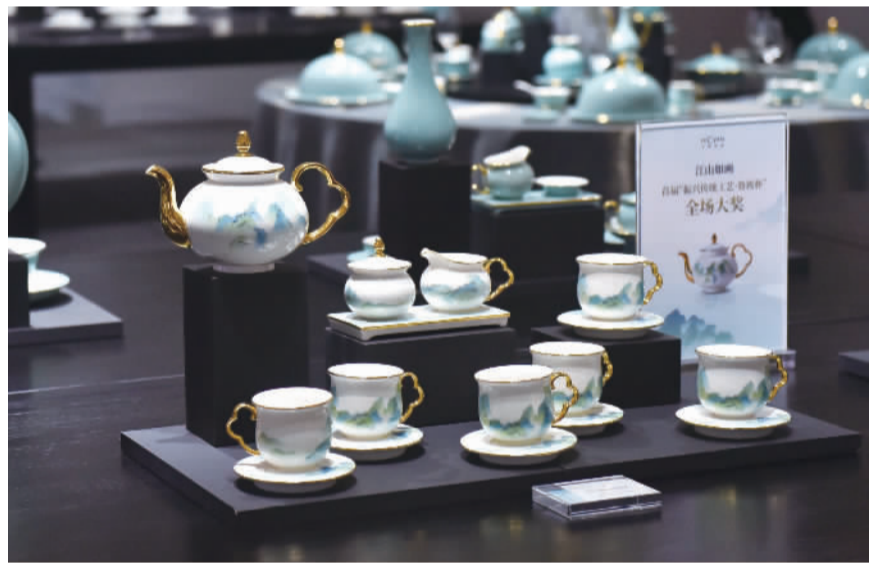
“振兴传统工艺·鲁班杯”全场大奖《江山如画》