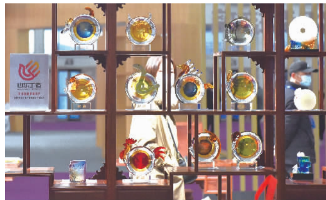
琉璃十二生肖作品