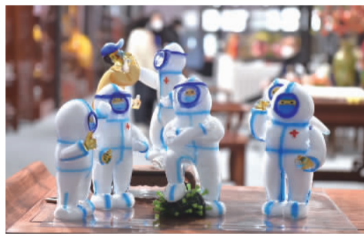
琉璃“大白”,作品取材于防疫、抗疫工作,展现“大白”在防疫抗疫工作中的精采瞬间,人物形态自然端庄,其中“大白”脚踏病毒、做核酸等动作更是惟妙惟肖,深受参观者喜爱