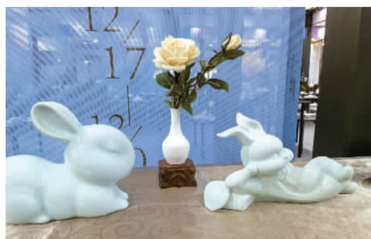
大师笔下的兔子被琉璃赋予了“灵魂”,以白玉料制作而成,成了兔年伴手礼的不二选择