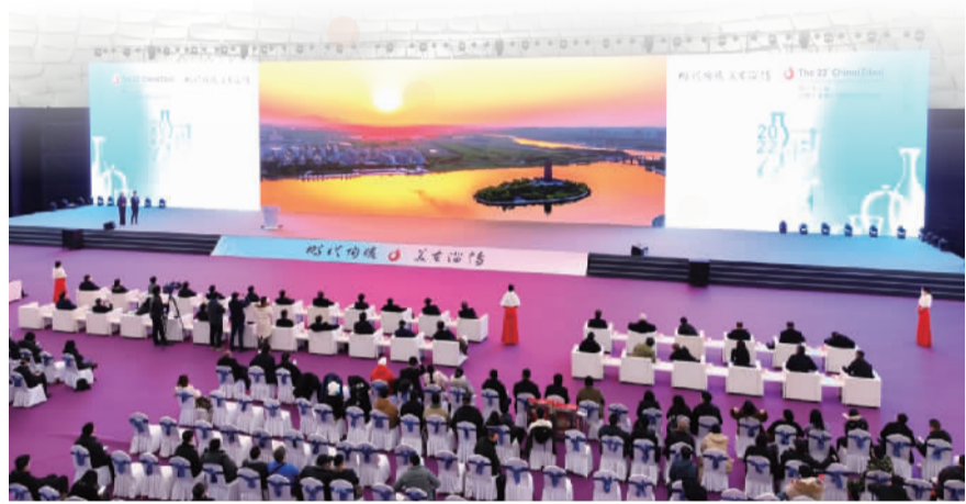
第22届中国(淄博)国际陶瓷博览会开幕式现场