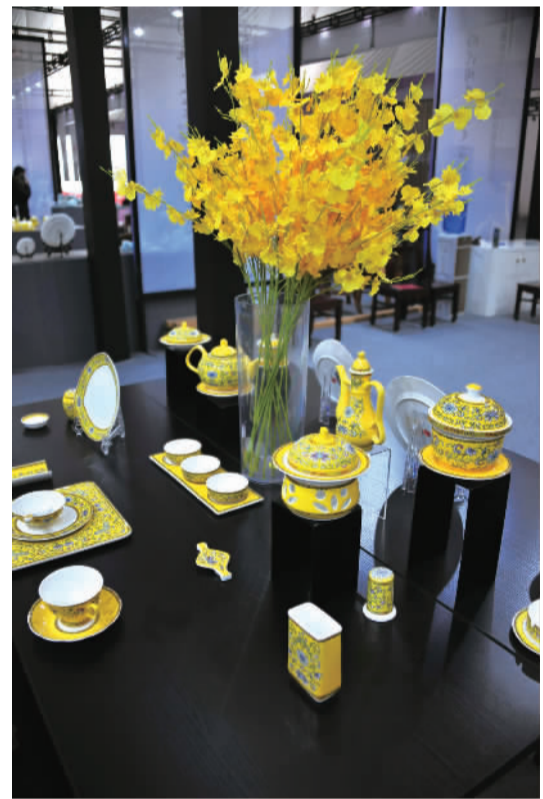
国宴用瓷——硅元“中华龙”