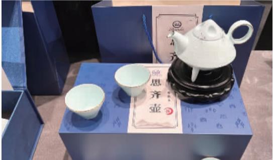
“见贤思齐焉,见不贤而内自省也。”在淄博人立琉璃展厅,外形由古“齐”字演变而得的思齐壶,引起了大家的兴趣