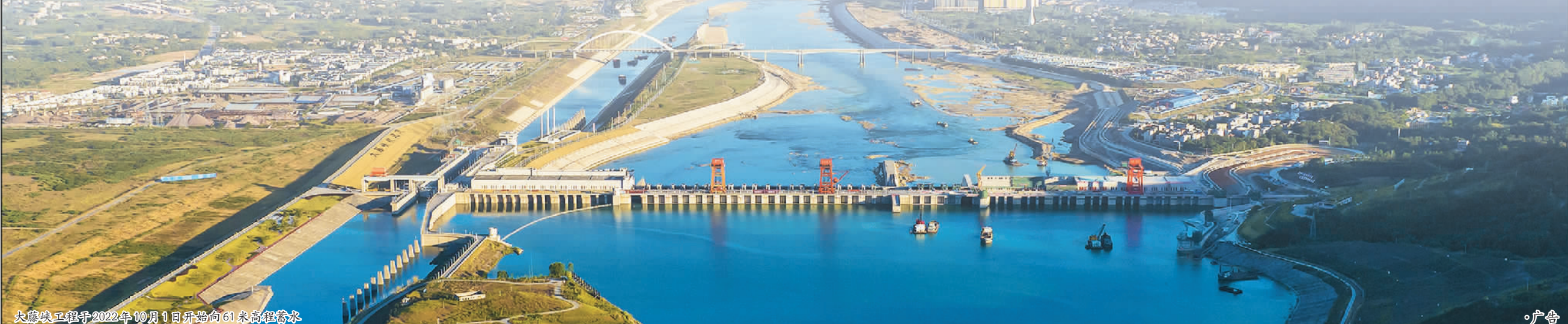
大藤峡工程于2022年10月1日开始向61米高程蓄水

大湾区城乡居民生活用水安全提供了有力保障。大藤峡工程今年已承担4次应急调水任务,累计调水量4.4亿立方米,优质淡水成为珠江流域抗旱保供水的“杀手锏”。今年7月以来,西江流域降雨持续偏少,上游来水偏枯,8月至10月大藤峡水库来水较多年同期偏少近7成。据水文气象部门预测,今冬明春珠江三角洲来水偏枯的可能性较大。大藤峡公司将不断提高政治站位,牢固树立以人民为中心的发展思想,统筹电力供应、保障航运等用水需求,提前储备水资源,充分做好珠江流域枯水期水量调度准备工作,坚决打赢抗旱保供水硬仗,全力确保粤港澳大湾区供水安全,为地方稳住经济大盘、助力流域经济社会高质量发展、提升粤港澳大湾区水安全保障能力作出新贡献。(数据来源:水利部宣传教育中心)