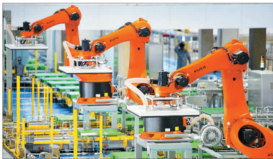
呼和浩特伊利得天独厚的自然条件，八年蝉联亚洲... 伊利连续