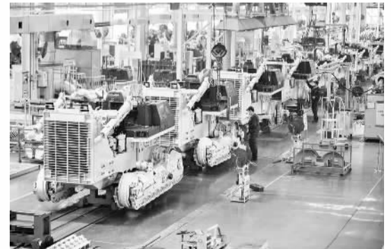
山推工程机械生产线

机器人产业的快速崛起，是济宁市聚焦新旧动能转换“十强”产业，坚持优存量、强增量协同发展的一个生动剪影。