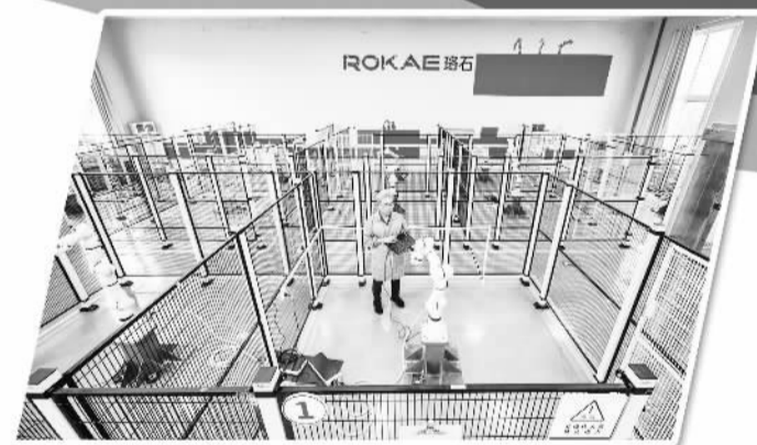
路石机器人测试车间