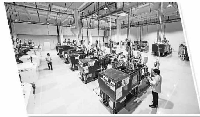
济宁海富电子科技有限公司