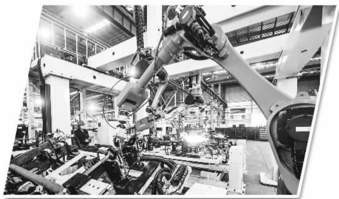
济宁能源海纳科技