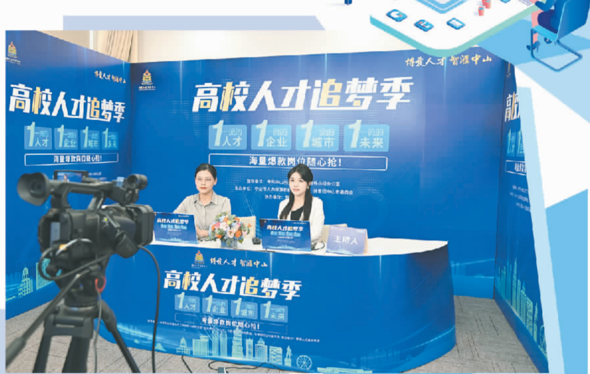
中山市人社部门组织开展“双11”云招聘会。(资料图片)

广东省人力资源和社会保障厅副厅长杨红山介绍说,“粤菜师傅”品牌影响力越来越大,“广东技工”产业支撑力越来越强,“南粤家政”服务群众能力越来越足,在稳定就业大局、服务产业发展等方面发