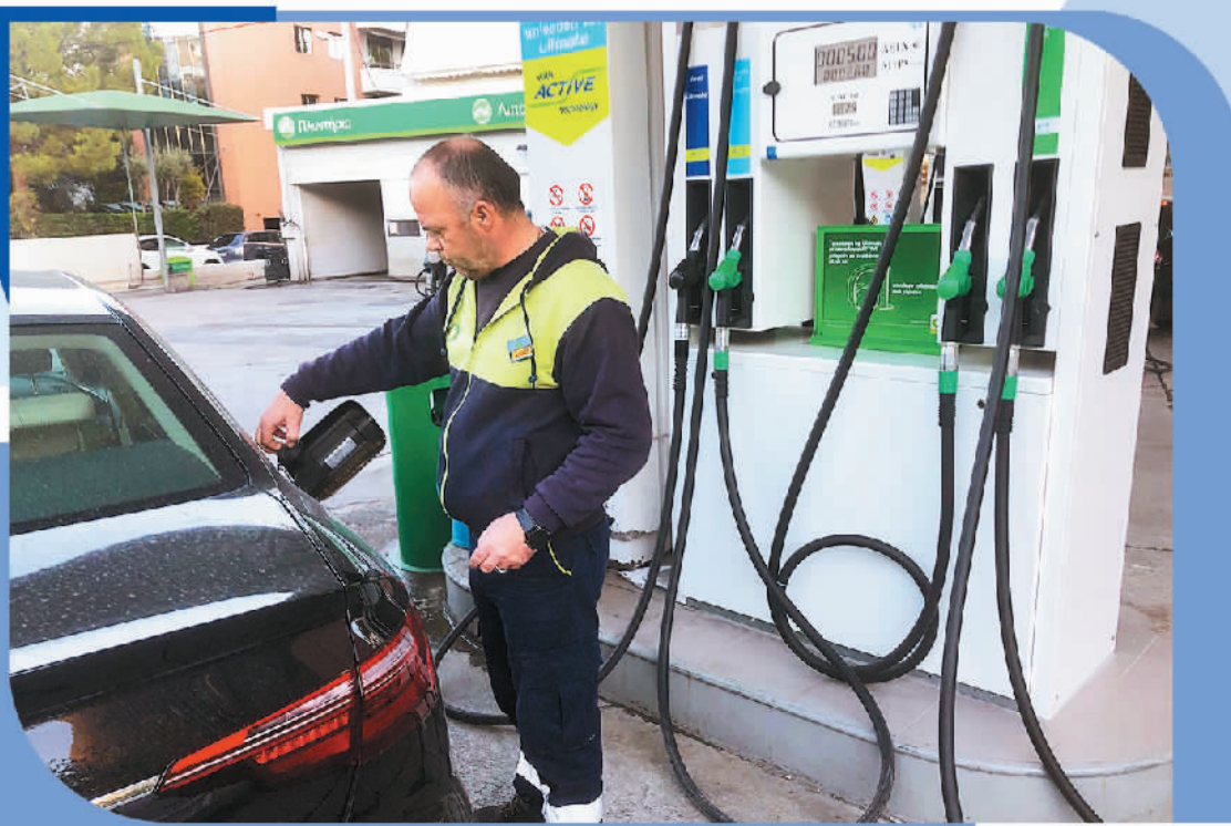
图为希腊加油站的一名员工正在为顾客汽车加油。

旅游季的努力白费。希腊著名旅游胜地罗德岛的酒店经营者协会主席马科普洛斯表示，“我们不必成为经济学家或者会计师就会明白，当收入只增加10%到15%，而能源成本却增加30%至40%，经济效果完全不同”。由于罗德岛酒店行业70%以上的营业额来自2021年与旅游经营者签署的低价合同，并未预料到今年的能源危机，使得诸多酒店企业无法承受高额成本增长，而面临倒闭风险。马科普洛斯称，以9月份为例，一家去年每月缴纳3万欧元电费的酒店，今年竟然收到了11万欧元至12万欧元的电费账单，没有企业能够负担得起如此高昂的能源成本。