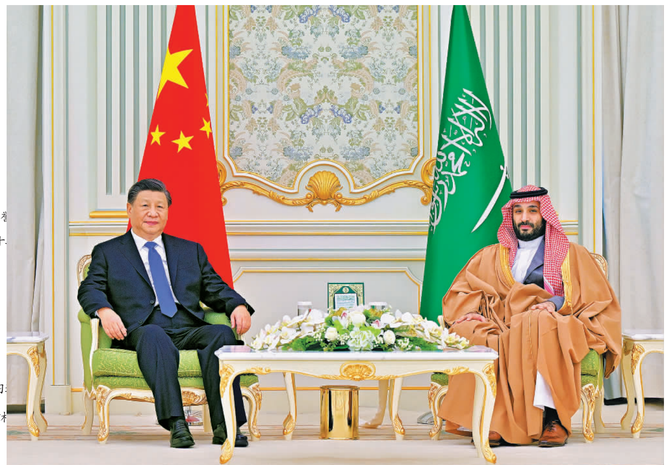
当地时间12月8日中午,国家主席习近平在利雅得王宫同沙特王储兼首相穆罕默德举行会谈。