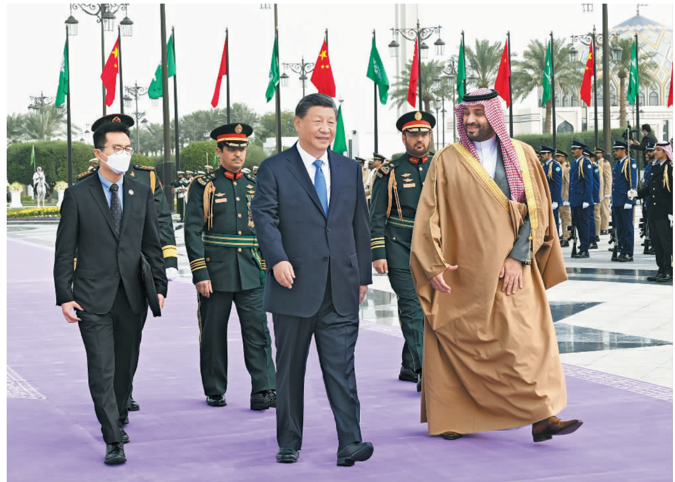
当地时间12月8日中午,沙特王储兼首相穆罕默德代表国王萨勒曼为正在沙特进行国事访问的国家主席习近平在利雅得王宫举行欢迎仪式。