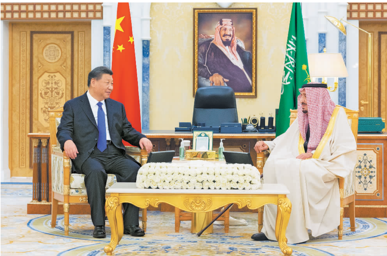
当地时间12月8日下午,国家主席习近平在利雅得王宫会见沙特国王萨勒曼。