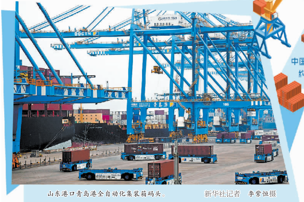
山东港口青岛港全自动化集装箱码头。

日前发布的《2022国际物流产业数字化发展报告》提出,数字化创新的百花齐放为物流的发展提出了新的挑战也带来了新的机遇。综合来看,物流+数字化成为国际贸易行业的重要发展趋势。我国航运业积极抓住这一契