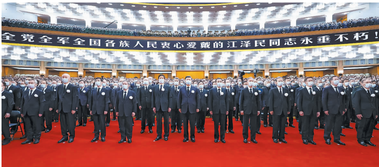
12月6日，中共中央、全国人大常委会、国务院、全国政协、中央军委在北京人民大会堂隆重举行江泽民同志追悼大会。习近平、李克强、栗战书、汪洋、李强、赵乐际、王沪宁、韩正、蔡奇、丁薛祥、李希、王岐山等参加大会。新华社记者 鞠鹏摄