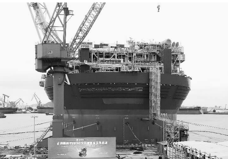
11月29日，由海洋石油工程股份有限公司承建，我国规模最大、智能化程度最高的浮式生产储卸油装置——企鹅FPSO在青岛西海岸新区完工并交付。该装置天然气处理能力12.4亿立方米/年，可满足330万户家庭一年的用气量。

国家邮政局相关负责人表示，受疫情影响，部分快递网点和从业人员作业存在受限情况，导致部分消费者短期内难以及时收到商品。目前，各级邮政管理部门还在积极推动行业保通保畅各项工作，疏解积压邮件快件。同时，加强与地方的对接协调，维护邮政快递基础设施正常运行，争取将邮政快递企业从业人员纳入白名单管理、为邮政快递车辆办理通行证，切实保障人民群众寄递服务需求。