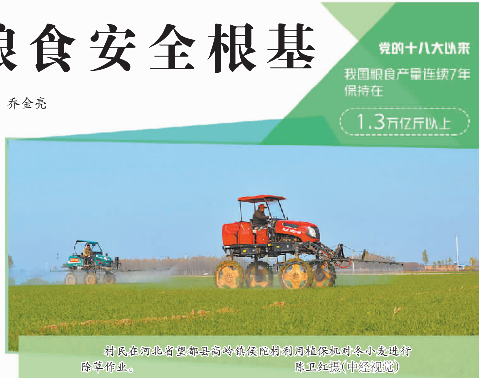
村民在河北省望都县高岭镇侯院村利用植保机对冬小麦进行除草作业。

中国社会科学院农村发展研究所所长魏后凯表示,树立大食物观,要正确处理粮食安全与食物安全、营养安全的关系。随着城乡居民消费结构的升级,丰富的畜产品、水产品等将有利于改善居民膳食营养结构,也是保障国家粮食安全的重要组成部分。