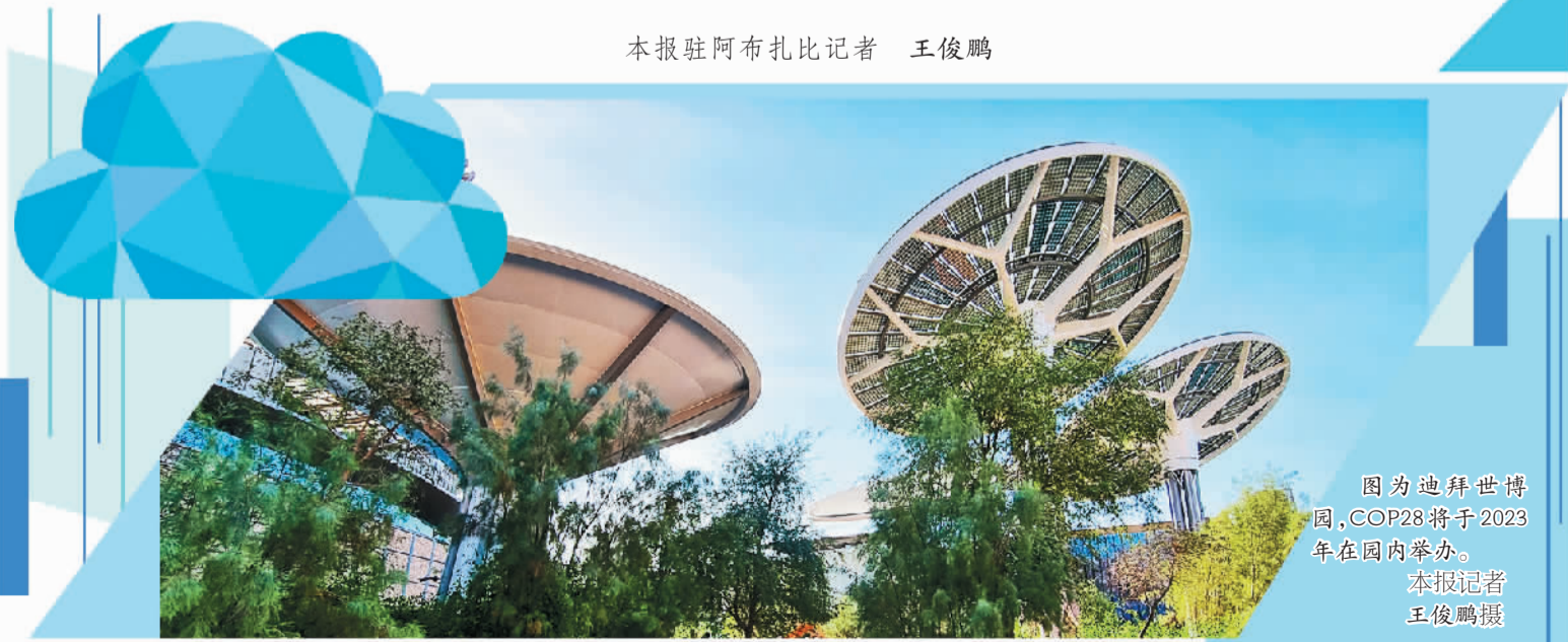
图为迪拜世博园,COP28将于2023年在园内举办。

《联合国气候变化框架公约》第27次缔约方大会(COP27)20日在埃及沙姆沙伊赫落下帷幕,作为下届缔约方大会(COP28)主办国,阿联酋高度重视推动全球应对气候变化。阿联酋总统谢赫·穆罕默德·本·扎耶德·阿勒纳哈扬在COP27上表示,阿联酋将继续致力于发挥其作为负责任的低碳能源供应者的作用,同时继续在阿联酋和世界各地对可再生能源进行投资。对