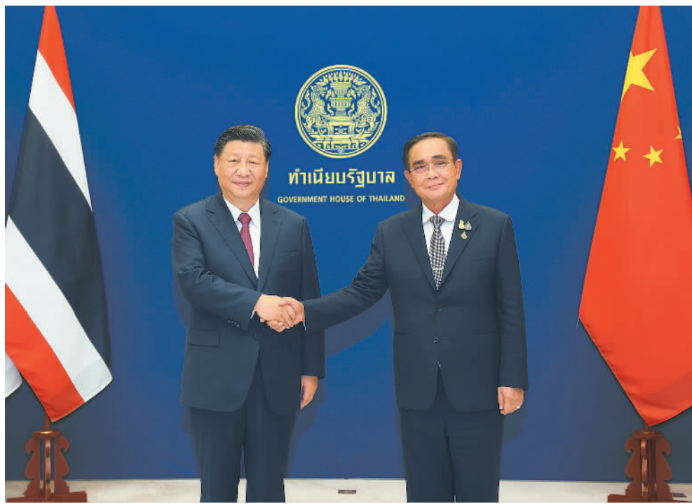
当地时间11月19日中午,国家主席习近平在曼谷总理府同泰国总理巴育举行会谈。