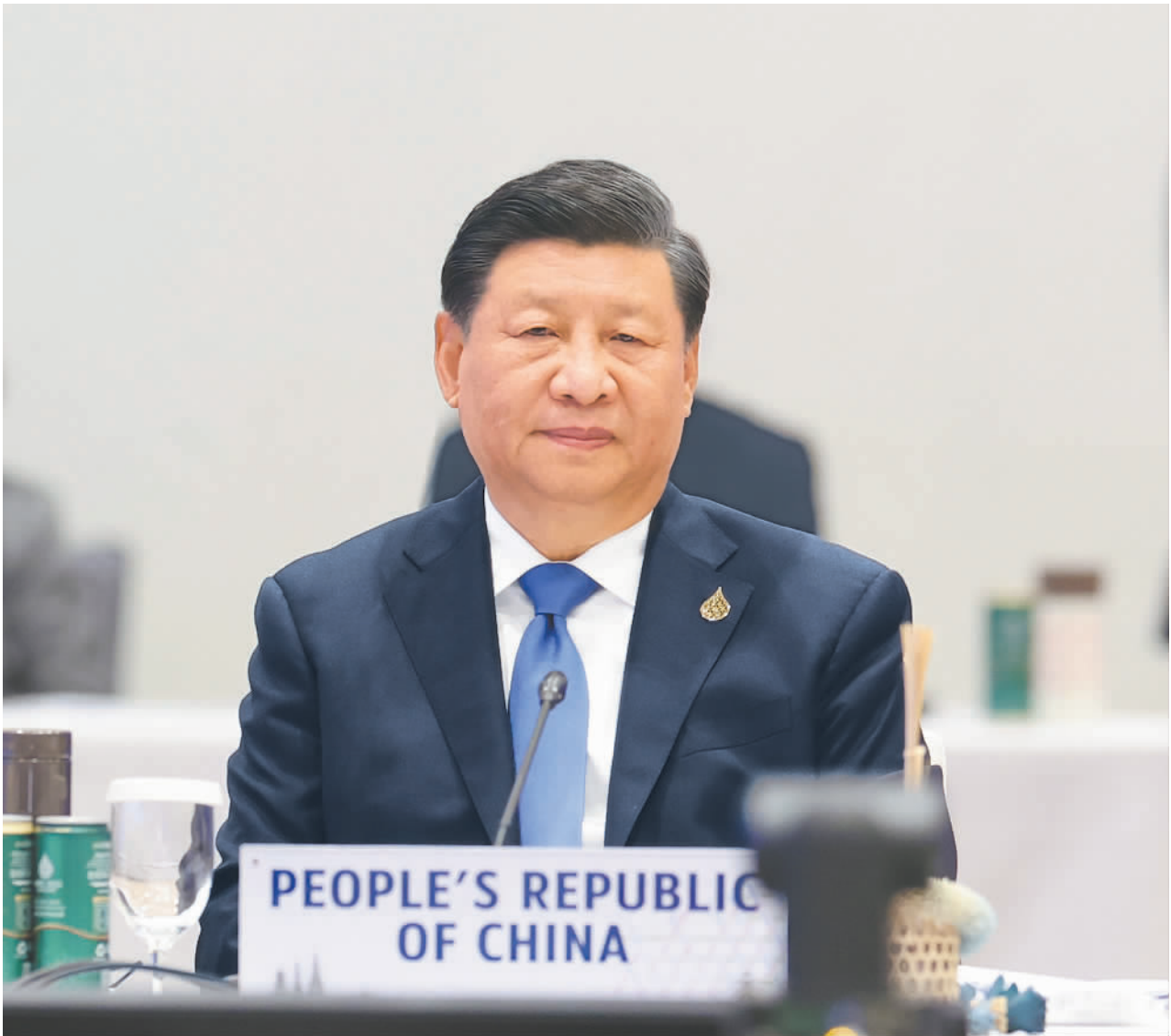
当地时间11月19日上午,国家主席习近平在泰国曼谷继续出席亚太经合组织第二十九次领导人非正式会议。