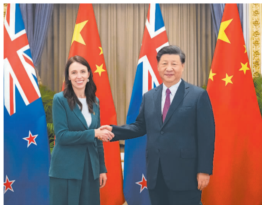
当地时间11月18日下午,国家主席习近平在泰国曼谷会见新西兰总理阿德恩。

新华社曼谷11月18日电(记者耿学鹏 周思雨)当地时间11月18日下午,国家主席习近平在曼谷会见新西兰总理阿德恩。