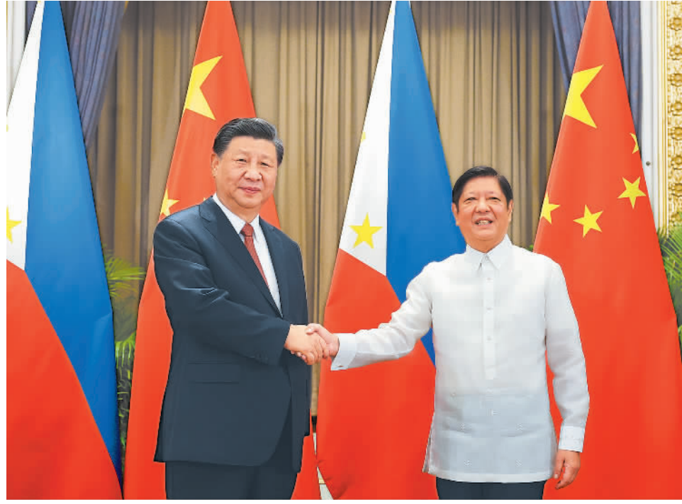
当地时间11月17日下午,国家主席习近平在泰国曼谷会见菲律宾总统马科斯。

新华社曼谷11月17日电(记者耿学鹏 毛鹏飞)当地时间11月17日下午,国家主席习近平在泰国曼谷会见菲律宾总统马科斯。习近平指出,中方始终从战略高度看待中菲关系。今年5月我们通电话时,就新时期中菲关系发展达成一系列重要共识,双方确立了农业、基建、能源、人文四大重点合作领域。双方要努力打造合作亮点,提升合作质量,造福两国人民。中方愿同菲方传承友谊,接续合作,共同致力于国家发展振兴,谱写中菲友好新篇章。习近平强调,中方愿同菲方保持经常性沟通,继续照顾对方关切。双方要持续深化“一带一路”倡议同菲律宾“多建好建”规划对接,建设好达沃-萨马尔大桥项目,探讨开展“两国双园”合作,加强清洁能源、教育、公共卫生合作。(下转第二版)