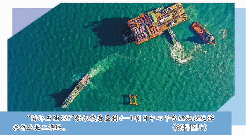
“海洋石油228”船承载着垦利6—1项目中心平台组块抵达浮托作业施工海域。

近日，渤海亿吨级大油田——垦利6—1油田最大区块7座平台全部完成海上安装，为项目按期投产打下基础。垦利6—1油田是我国渤海莱州湾北部地区勘探发现的首个亿吨级大型油田，也是我国第一大原油生产基地。2022年，在探明的最大原油增产项目，石油探明地质储量超过1亿吨，建成投产后可供100万辆汽车行驶20余年。