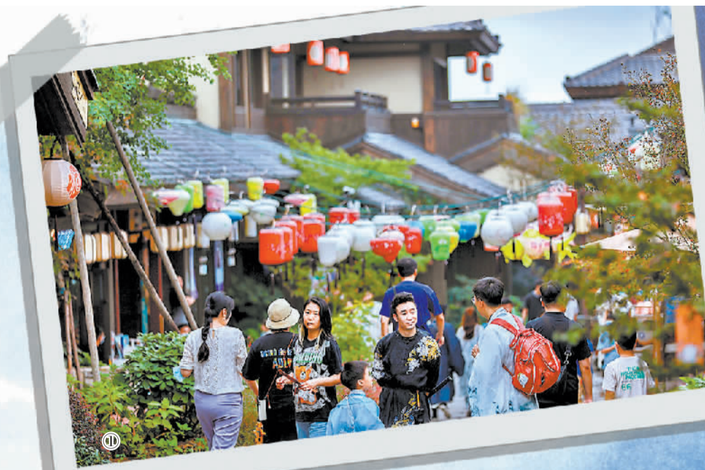
图① 游客在阿朵花屿体验沉浸式剧本游戏《藏花集》。 图② 阿朵花屿奇幻光影世界一角。

阿朵花屿汇聚了8个风格迥异又各具特色的民宿品牌，可以满足不同游客群体的需求。“有的民宿主打怀旧风，设计了绘灯、画虎、秀汉服等传统文化活动；有的民宿以亲子为主题，以足球、乐园、奶油胶等元素打造梦幻乐园；还有的民宿以女性闺蜜