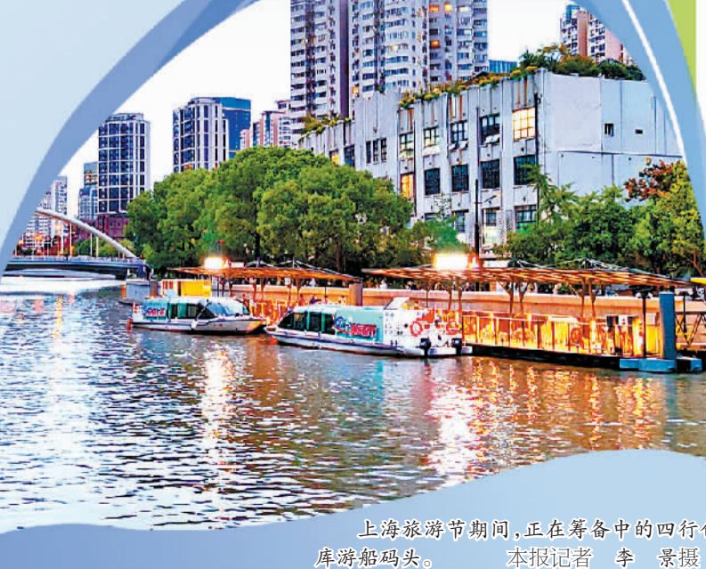
上海旅游节期间，正在筹备中的四行仓库游船码头。

说，上海要继续深化水岸联动，充分利用苏州河两岸的历史建筑、风貌街区、革命遗址和工业遗址，建设更多“小而美”的演艺新空间、人文新景观、休闲好去处，培育主题型、特色化的水岸节展赛事活动，让高品质、高颜值、高能级、全天候成为苏州河旅游的标签，提升都市型旅游新体验。