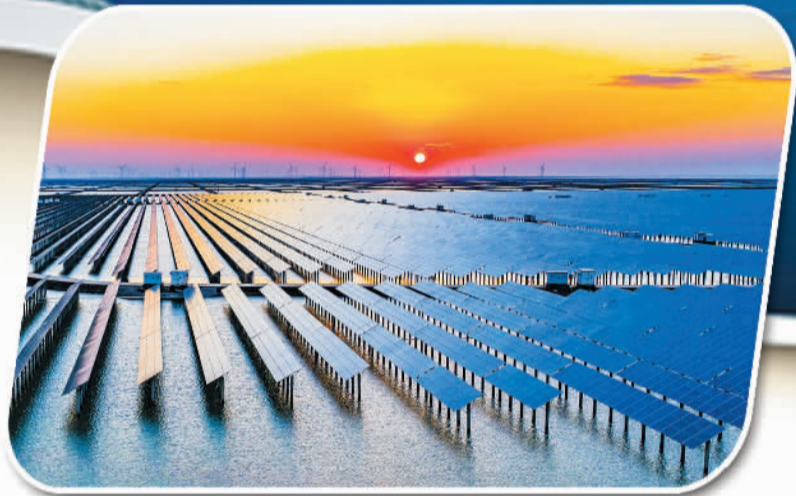
黄河口新能源之光