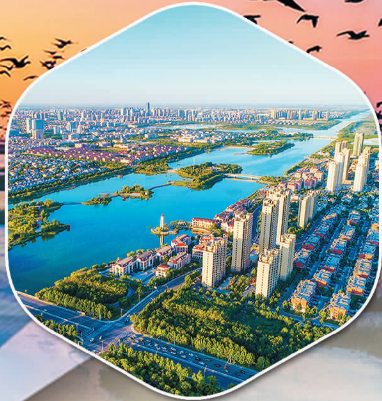
东营市创建成为全球首批“国际湿地城市”、2021中国生态竞争力城市