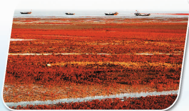
防潮堤滩涂张象江