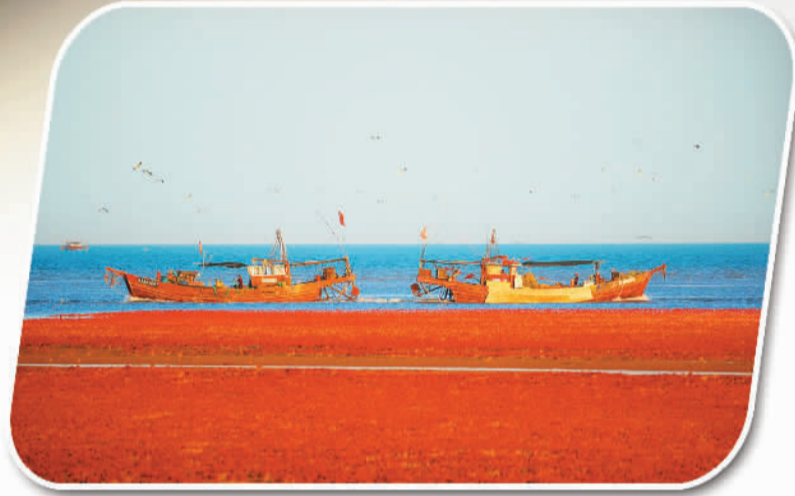
近日,满载而归的渔船在夕阳下驶向垦利区红光渔港。日前,东营市各渔港渔民们脸上洋溢着丰收的喜悦,忙着装卸、挑拣、过磅、调运……码头呈现一派繁忙的景象