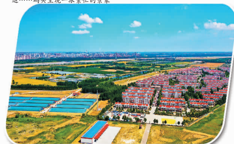
航拍杨庙社区新貌,黄河堤坝内,黄河浩荡,奔涌向前;堤坝外,一排排红顶白墙的住宅楼整洁有序,处处洋溢着盎然生机和新活力