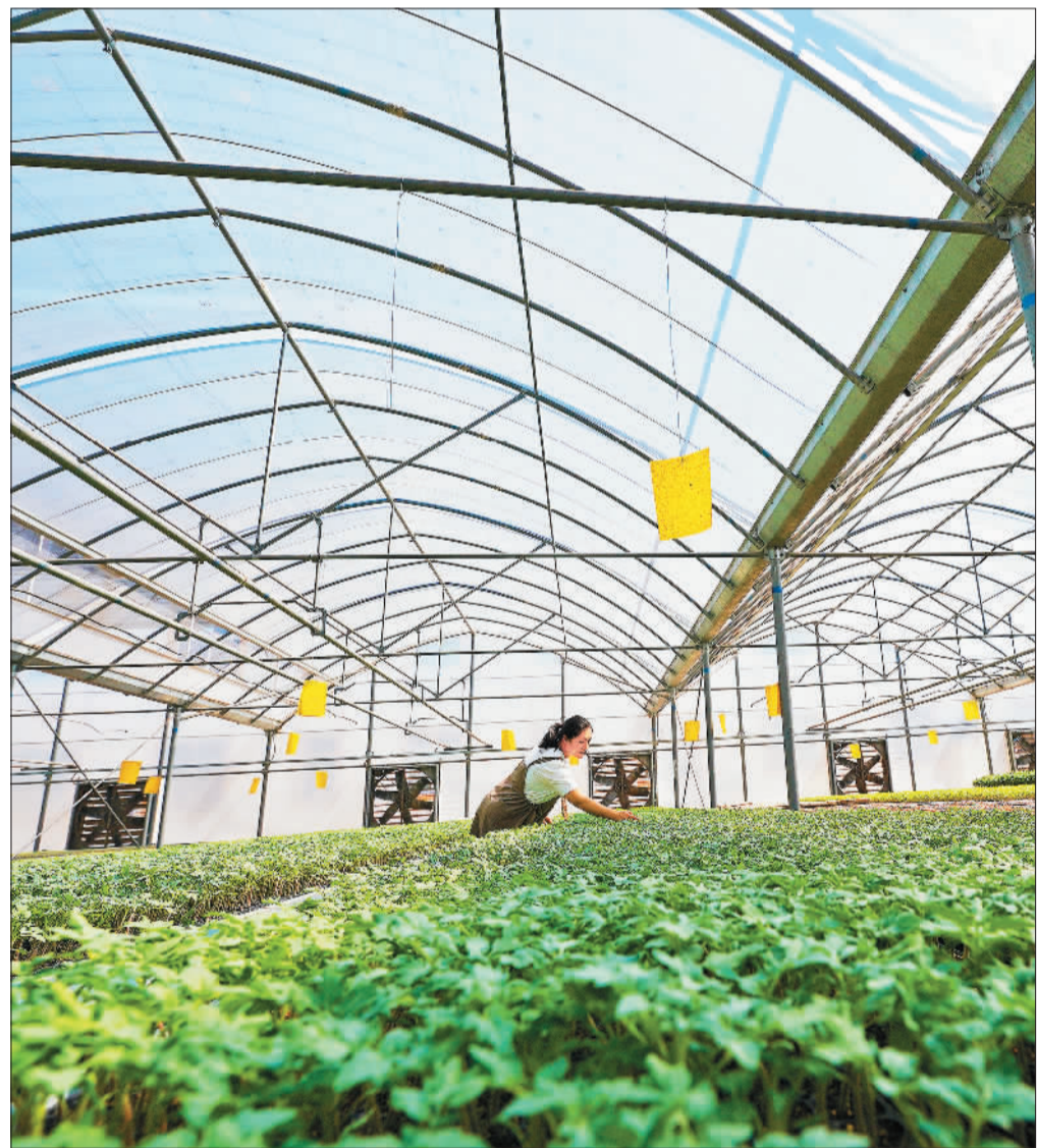
宁河区的百利种苗基地，员工在查看青苗长势。该基地供应京津冀万余家农户，年种苗产能达到1亿株。