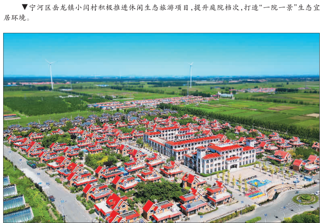
宁河区岳龙镇小闫村积极推进休闲生态旅游项目，提升庭院档次，打造“一院一景”生态宜居环境。