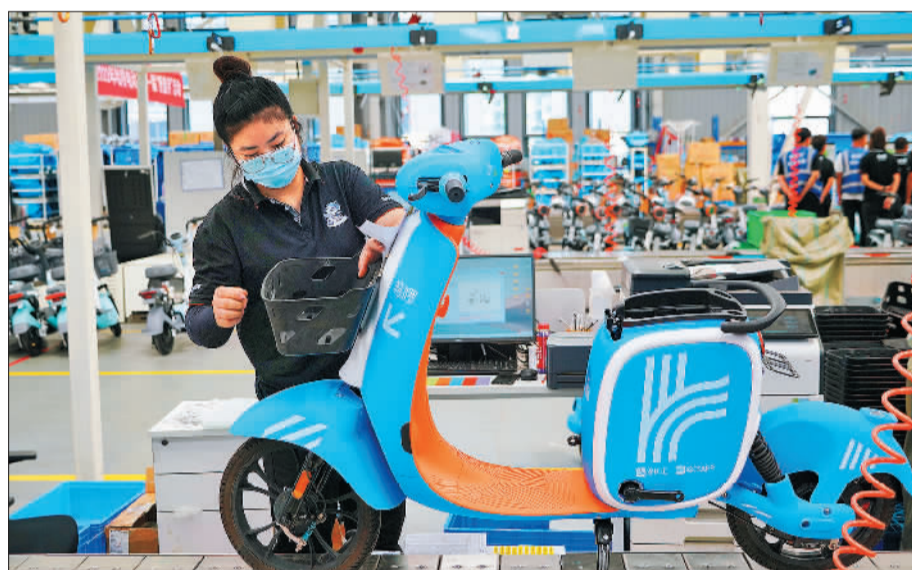
位于宁河区的天津哈啰电动车超级工厂，目前，电动车产能达到年产300万辆。