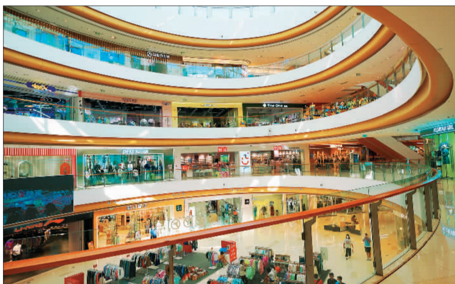
顾客在宁河区宁河吾悦广场购物。近年来，该区以多元化的新业态组合，助推区域商业高质量发展。