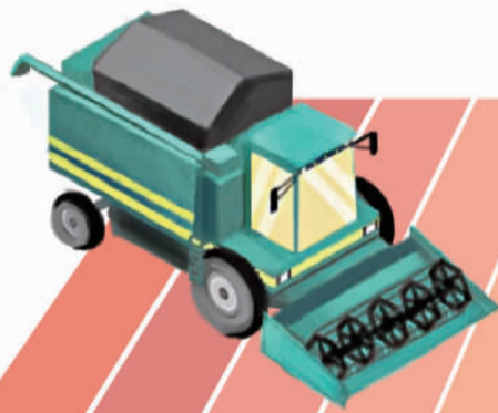
▼农业机械总动力(万千瓦)