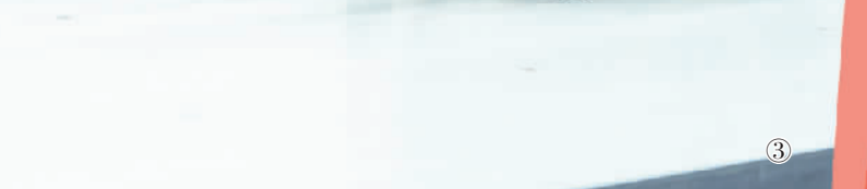
图③ 北京顺义中国残疾人体育运动管理中心国家残疾人冰上运动比赛训练馆，中国轮椅冰壶队队员在训练。