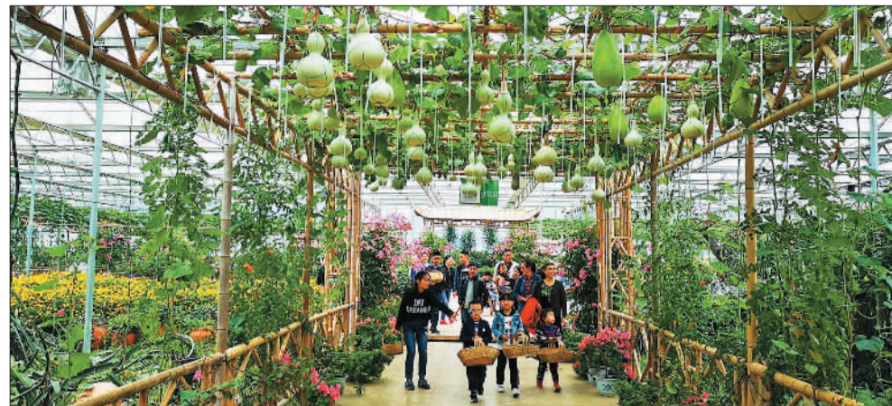
▲游客在贵阳市开阳县双流镇盛丰田园农趣谷游览。开阳县深耕休闲农业与乡村旅游市场，以旅促农、以旅富农、农旅互动，促进城乡共同发展。