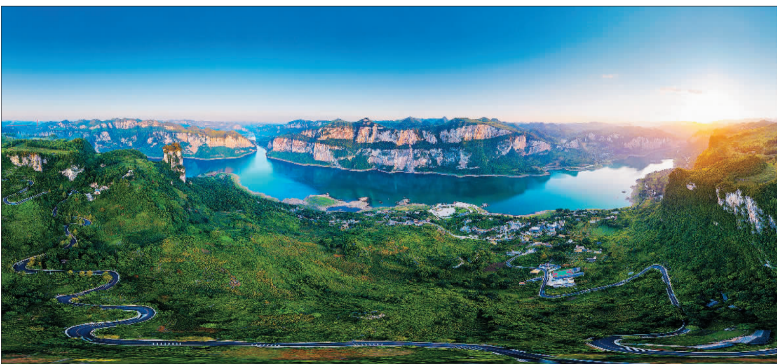
▲乌江百里画廊黔西市新仁苗族乡化屋村风光。贵州举全省之力治理乌江，水质环境持续改善，去年乌江干流水质达到Ⅱ类标准，流域水质总体为“优”。