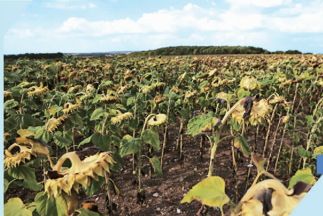
图为法国巴黎西北约30公里处的皮伊塞—蓬图瓦兹一处受旱情影响的向日葵田。

三是干旱压力短期难解。法国农业部农业和渔业管理局此前发布的报告显示,全法处于良好状态的玉米耕地比例已下降至68%。短期扭转干旱对粮食领域的冲击几乎不可能。同时,法国等欧洲国家虽在必要时可从巴西、美国等寻求进口替代,但碍于欧洲相关领域法规,特别是对转基因农作物的监管限制,将使域外粮食进口程序变得极为复杂,难解燃眉之急。而且,干旱不仅直接导致农作物减产,更对土壤质量造成巨大破坏,极大影响其透水性,使土地无法短期吸收大量雨水,增大未来短期极端性降水后遭遇洪涝灾害的风险,加之法国境内气候差异性明显加