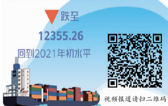
视频报道请扫二维码

上海隧道工程股份有限公司(以下简称“隧道股份”)是一家较早“走出去”的中资企业,早在1996年就选择了国际化发展路线,进军新加坡市场,在当地成立了上海隧道工程股份(新加坡)有限公司。经过27年的经营发展,如今,隧道股份新加坡公司已成为当地著名的土木工程施工总承包商,在经济与社会效益方面实现了双丰收,为促进中新“一带一路”合作作出了积极贡献。