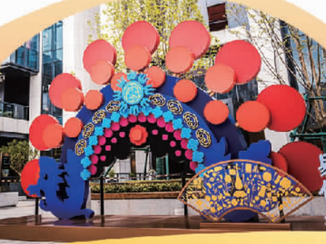
易俗社文化街区展示秦腔演员精美头饰的造型，方便游客拍摄“打卡”。

虽然弦歌不断，然而和许多地方戏一样，秦腔也面临着生存与发展的现实危机。随着城镇化进程，农村居民不断减少，方言使用场景减少，文化休闲的可选择种类繁多。秦腔在传统优势区群众的精神文明生活中，有从必不可少的主旋律转为调味品的倾向。 “秦腔是我们梆子戏的鼻祖，豫剧很多唱