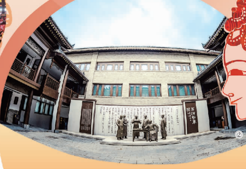
图① 在西安大唐不夜城举行的公益性秦腔演出。本报记者 杨开新摄 图② 易俗社百年博物馆院内，再现上世纪初期著名秦腔科班易俗社创办场景的人物雕塑。

《千古一帝》中的嬴政、《火焰驹》中的黄桂英、《关西夫子》中的杨震、《杨门女将》中的穆桂英、《大秦将军》中的王翦……这些秦腔剧目中的人物形象堪称经典，不少名角因之摘取中国戏剧表演艺术最高奖梅花奖。 在西安，上述人物形象被印在卡通贴纸、手机上，人们把它粘在手机壳上，秦腔这门独具魅力的古老艺术，也以随处可见、随处可见的形式走进千家万户。