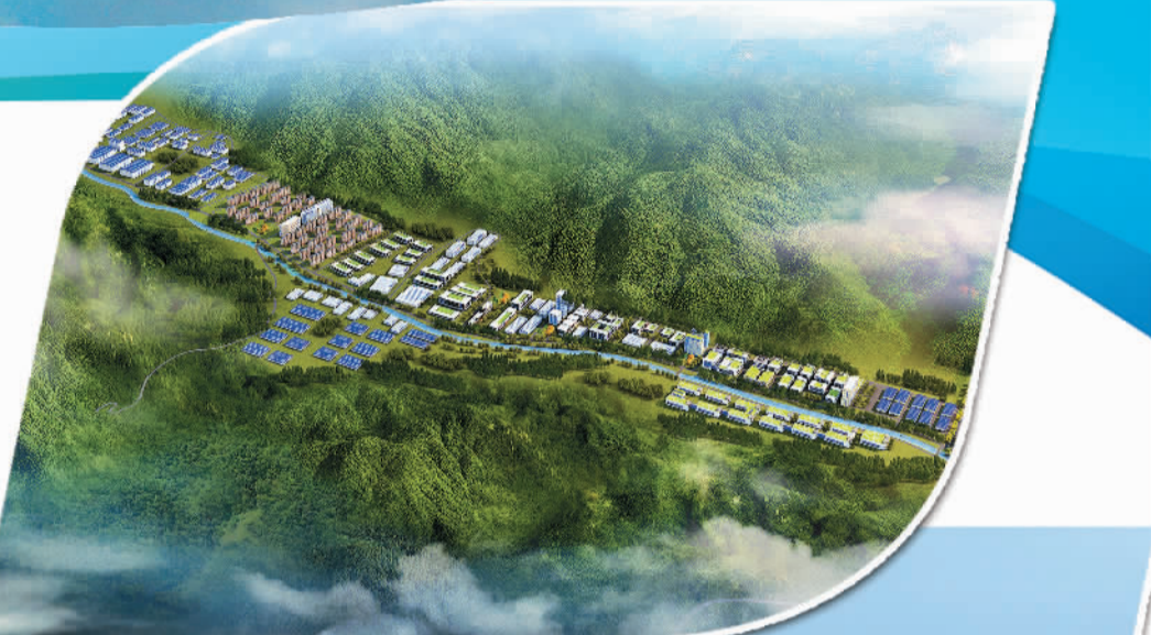
赤城经济开发区效果图