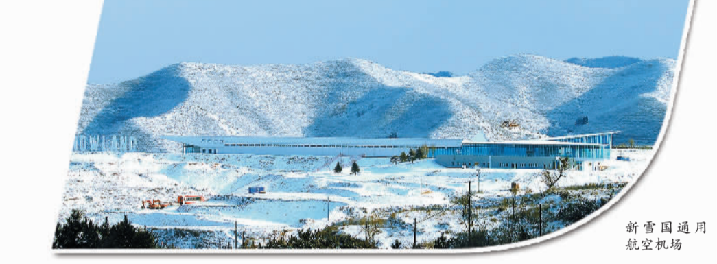
新雪国通用航空机场

项目 黑龙山国家森林公园位于赤城县东北部，西距县城80公里，南距北京市260公里。黑龙山林场景区有黑河源、东猴顶、响水谷3个景区，并于2017年12月14日拿到国有土地111亩，经过3到5年开发投资超过12亿元，年游客超过50万人。项目总投资5亿元，资金来源为企业自筹及招商引资。