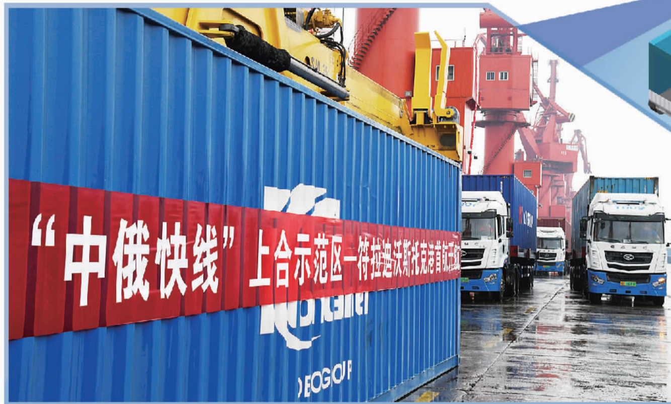
2022年9月14日，在青岛港大港码头，货车在运送首趟“中俄快线”集装箱。当日，“中俄快线”上合示范区一符拉迪沃斯托克港首航仪式在青岛港举行。货轮装载着日用品、机械配件、化妆品等物资，共计346个标准箱。

“我相信，此次在乌兹别克斯坦撒马尔罕举办的上合峰会，将进一步推动各成员国在经济发展等诸多议题上的务实合作。”夏巴兹·谢里夫表示，巴中两国将继续携手共进、紧密合作，为地区发展共同作出贡献。