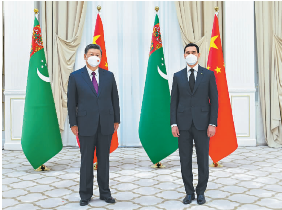
当地时间9月15日上午，国家主席习近平在撒马尔罕国宾馆会见土库曼斯坦总统谢尔达尔·别尔德穆哈梅多夫。

新华社北京9月15日电（记者赖毅）当地时间15日上午，国家主席习近平在撒马尔罕国宾馆会见土库曼斯坦总统谢尔达尔·别尔德穆哈梅多夫。