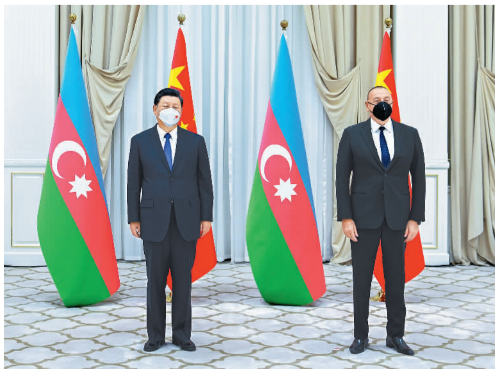
当地时间9月15日下午，国家主席习近平在撒马尔罕国宾馆会见阿塞拜疆总统阿利耶夫。

新华社北京9月15日电（记者赖毅）当地时间15日下午，国家主席习近平在撒马尔罕国宾馆会见阿塞拜疆总统阿利耶夫。习近平指出，今年是中阿建交30周年。中方支持阿塞拜疆人民自主选择的发展道路。双方要从战略高度看待和规划两国关系，增进战略互信，加大相互支持，深化互利合作，推动两国各领域合作走稳、走深、走实。