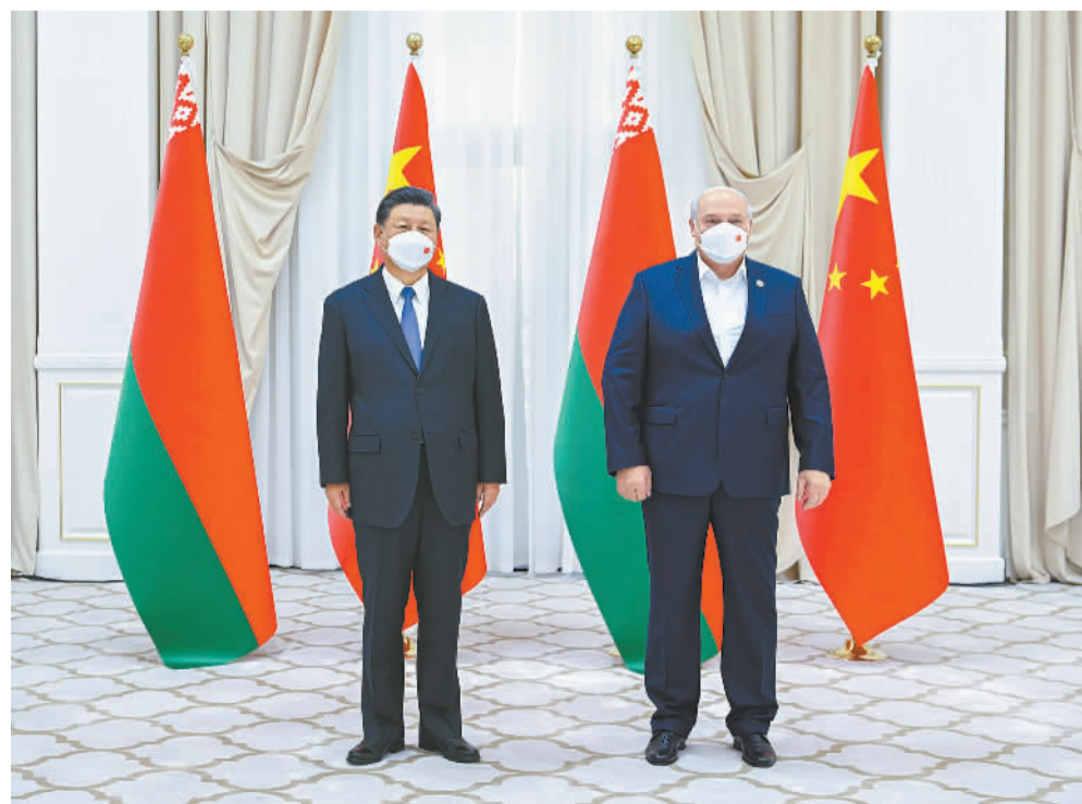
当地时间9月15日下午，国家主席习近平在撒马尔罕国宾馆会见白俄罗斯总统卢卡申科。

新华社北京9月15日电（记者赖毅）当地时间15日下午，国家主席习近平在撒马尔罕国宾馆会见白俄罗斯总统卢卡申科。两国元首决定，将双边关系定位提升为全天候全面战略伙伴关系。