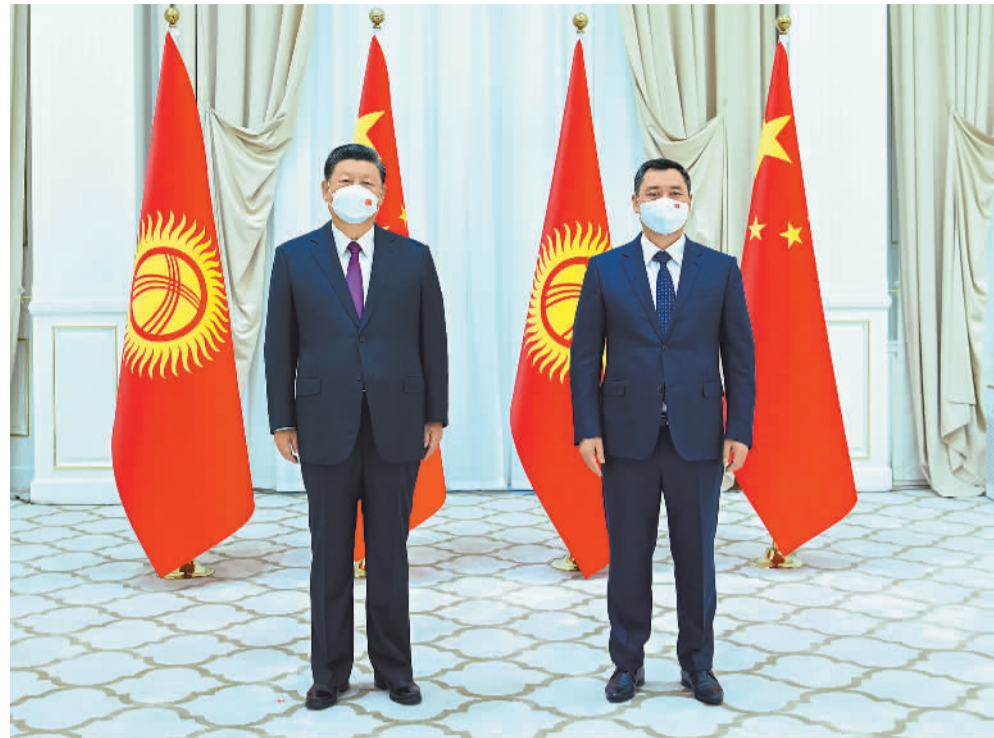
当地时间9月15日上午，国家主席习近平在撒马尔罕国宾馆会见吉尔吉斯斯坦总统扎帕罗夫。

新华社北京9月15日电（记者赖毅）当地时间15日上午，国家主席习近平在撒马尔罕国宾馆会见吉尔吉斯斯坦总统扎帕罗夫。