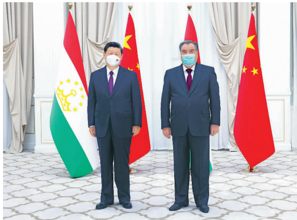
当地时间9月15日上午，国家主席习近平在撒马尔罕国宾馆会见塔吉克斯坦总统拉赫蒙。

新华社北京9月15日电（记者赖毅）当地时间15日上午，国家主席习近平在撒马尔罕国宾馆会见塔吉克斯坦总统拉赫蒙。