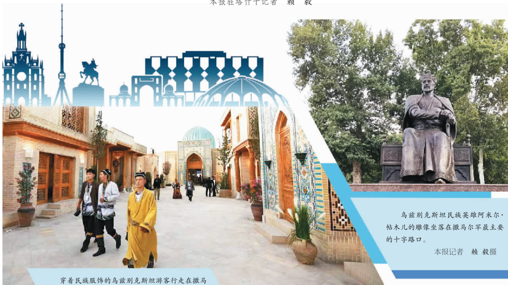
穿着民族服饰的乌兹别克斯坦游客行走在撒马尔罕重建的古城建筑群中。 本报记者 赖毅摄