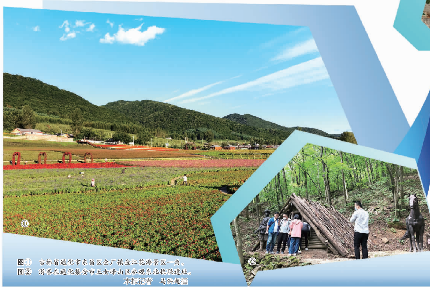
图① 吉林省通化市东昌区金厂镇金江花海景区一角。 图② 游客在通化集安市五女峰山区参观东北抗联遗址。

酒之乡”“中国人参之乡”“中国中药材之乡”。多年来,当地一直十分重视推进相关产业与文旅业融合发展。