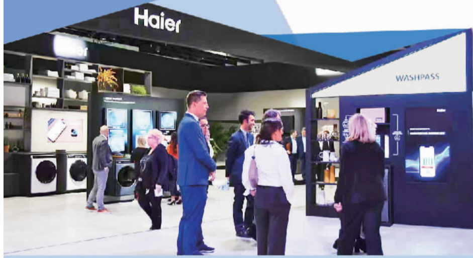
图为柏林国际消费电子展现场。

本届展会共吸引 ● 46个国家和地区1100多家展商 ● 中国展商超过260家,约占总数四分之一