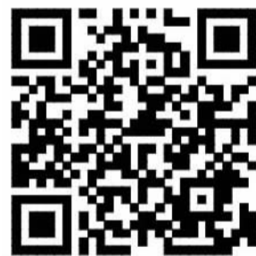
视频报道请扫二维码