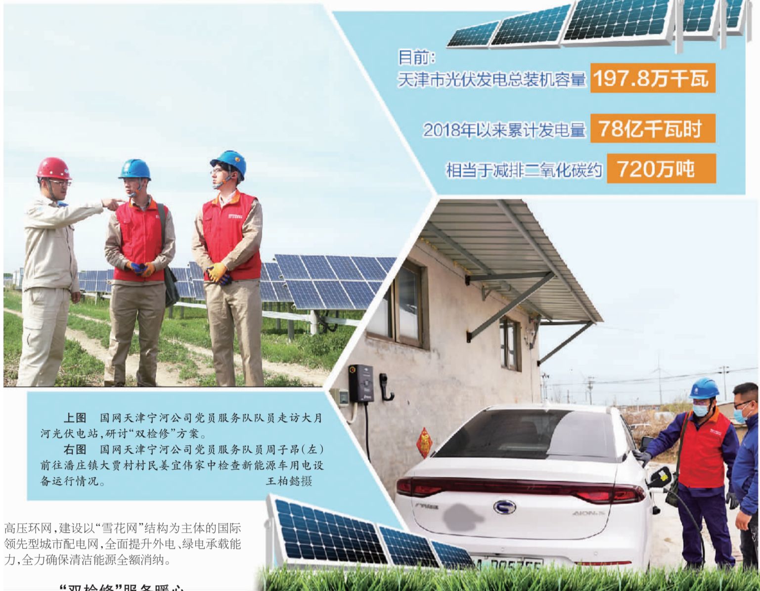
上图 国网天津宁河公司党员服务队队员走访大月河光伏电站，研讨“双检修”方案。 右图 国网天津宁河公司党员服务队周子昂(左)前往潘庄镇大贾村村民姜宜伟家中检查新能源车用电设备运行情况。

8月5日，是天津市首座100千瓦级光伏电站在蓟州区邦均镇大街村启用两周年的日子。“两年来，这座光伏电站成了村里的‘阳光银行’，村民致富离不开光伏发电的收益。”看着屋顶上一个个太阳能光伏板，大街村党支部书记代浩杰说。