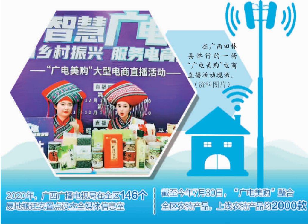
2020年,广西广播电视局在全区146个易地搬迁安置点设立全媒体信息室

近年来,广西大力推进“智慧广电”建设,以广西广电融合媒体云平台(以下简称“广西‘广电云’”)为依托,积极探索推动“短视频、直播+扶贫”“电视+电商”“线上+线下”等模式,立足行业优势,结合热点消费模式,以消费帮扶巩固拓展脱贫攻坚成果与乡村振兴有效衔接。