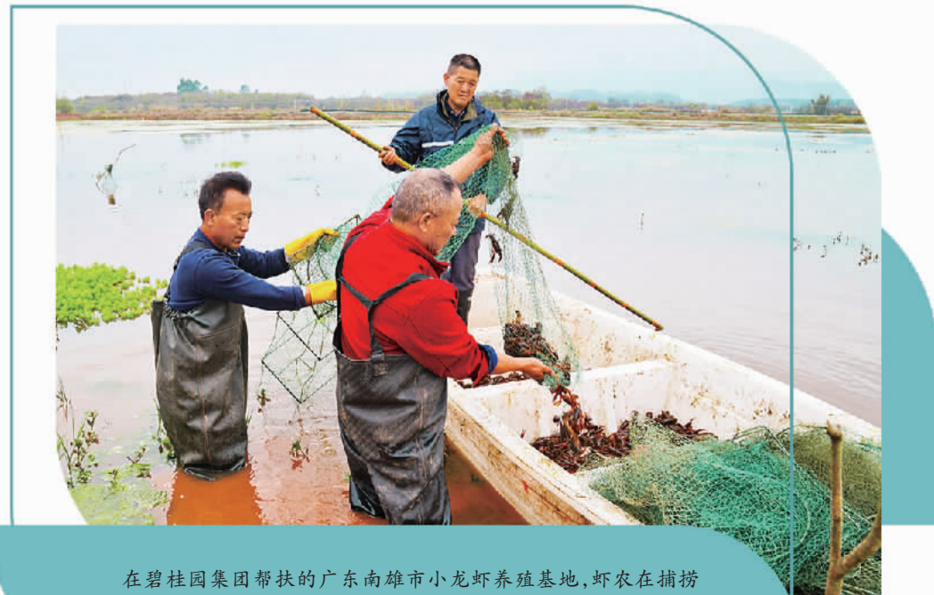
在碧桂园集团帮扶的广东南雄市小龙虾养殖基地,虾农在捕捞小龙虾。(资料图片)