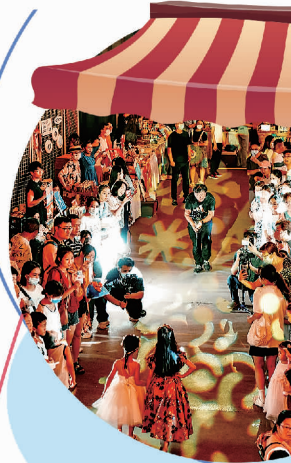
瑞光夜市集上的少儿礼服走秀表演。

盲盒说到底是一种外在营销方式的创新,玩多了,消费者的热情难免下降,盲盒的长远发展终究还要回归内里。潮玩之所以被大众喜爱,很重要的原因是IP,对盲盒IP进行精耕细作、注入个性内涵,让其深入人心,或许才是支撑盲盒一直热下去的底气所在。