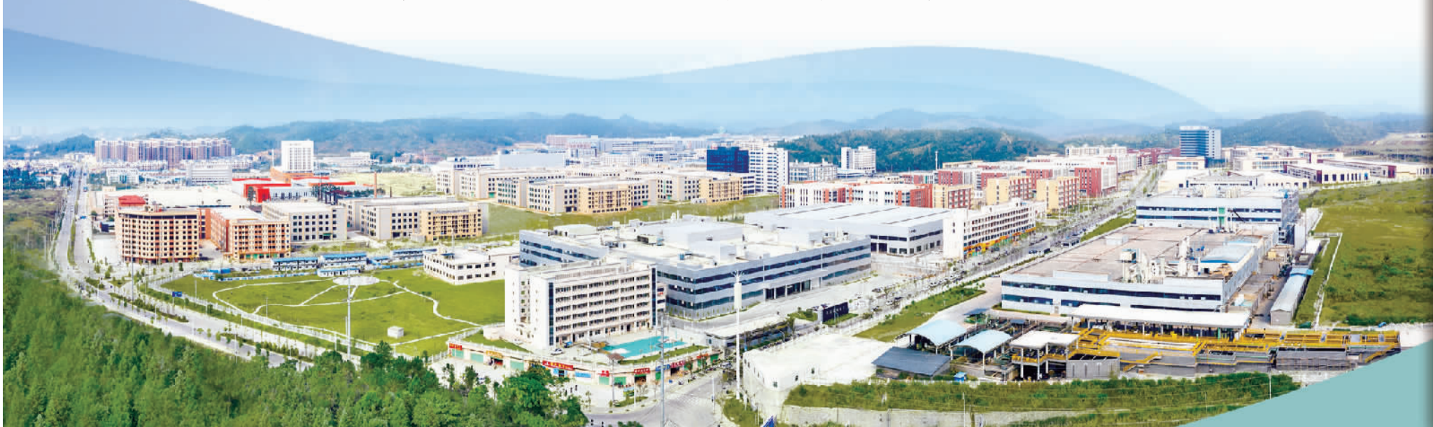
龙南经济技术开发区俯瞰图。