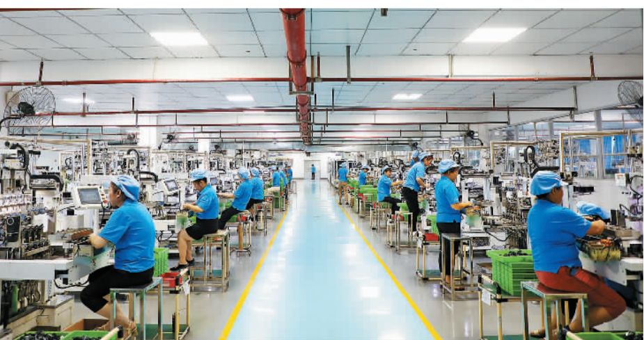
日前,工人在湖南省资兴市慧华电子有限公司生产车间赶制订单。近年来,该市以科技创新为驱动,深入实施科技创新平台快速发展、高新技术企业快速增长、专精特新“小巨人”企业培育三大专项行动,通过加大政策、资金、人才等方面的扶持力度,推动一批“专精特新”中小企业高质量发展。

“产业援藏还有一个最大作用就是促进了大学生和农牧民群众就业。”田广华说,多年来,通过积极发展受援地特色优势产业和劳动密集型产业,支持受援地培育龙头企业、合作社等新型农业经营主体,加强农牧民生产技能和就业能力培训;同时,在实施援藏项目过程中更加注重吸纳本地群众就业等一系列抓产业促就业措施,西藏大学生就业一直保持着较好水平,受援地各族群众拓展了收入渠道,得到了实实在在的好处、看得见摸得着的实惠。