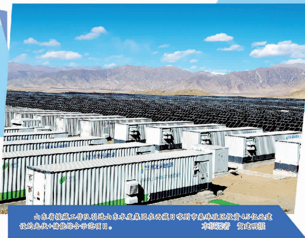
山东省援藏工作队引进山东水发集团在西藏日喀则市桑珠孜区投资4.5亿元建设的光伏+储能综合示范项目。

“您好,您要选什么样的眼镜?”“我主要在室外工作,镜片我想选有防紫外线功能的。”近日在西藏拉萨市达孜·丹阳眼镜城大厅内,工作人员德吉正在热情地帮助顾客挑选眼镜。